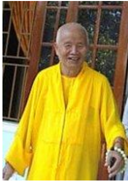
ВЬЕТНАМ: Тхич Хуен Кванг

Последние 24 года Тхич Хуен Кванг провёл под домашним арестом из-за своих выдающихся действий в защиту религиозных свобод. Вьетнамское правительство запретило его церковь из-за желания контролировать все религиозные институты в стране. Начиная с 1977 года, Кванга многократно задерживали, пока, наконец, в 1982 году не поместили под домашний арест, так и не предъявив обвинений и не проведя справедливого судебного разбирательства. Есть сведения, что он страдает заболеванием сердца и лёгочной инфекцией. Amnesty International не располагает дальнейшей информацией о Кванге и его освобождении.