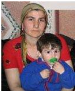
РОССИЙСКАЯ ФЕДЕРАЦИЯ, ЧЕЧНЯ